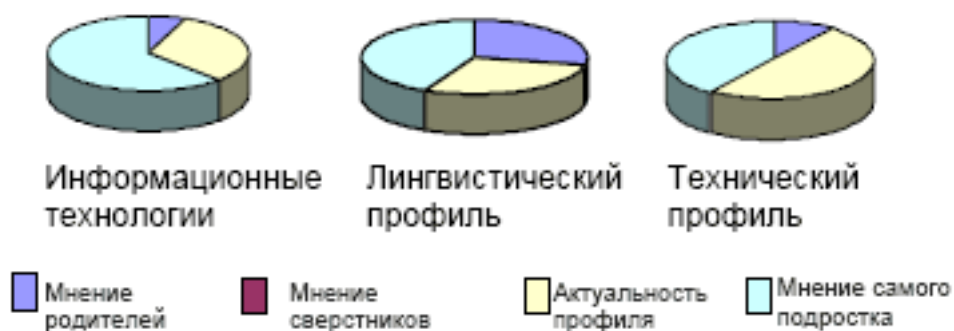
Рис. 1. Мотивация выбора профиля обучения.

На втором этапе мы выявляли особенности семейных отношений подростков как фактора, влияющего на их профориентационный выбор посредством методики «Рисунок семьи» и теста эмоциональных отношений в семье Бене-Антони. Мы ориентировались в большей степени на показатели авторитета одного из членов семьи и эмоциональной близости с одним из них.